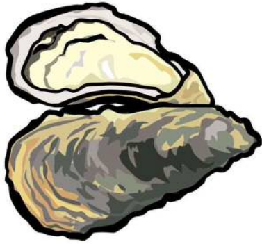
広島産牡蠣肉エキス 1500mg